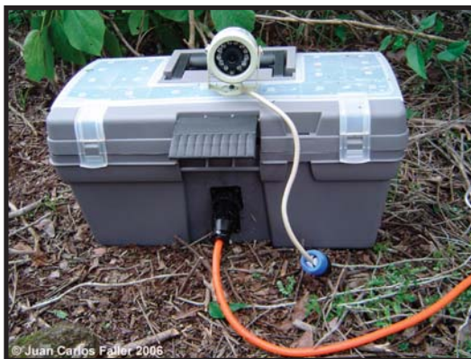
Figura 2. Prototipo de video-cámara usado para la filmación de jaguares en el norte de Yucatán.

oeste), menos de 50 metros hacia el oriente de donde entre mayo y julio una estación de fototrampeo obtuvo varias imágenes de tres jaguares machos distintos.