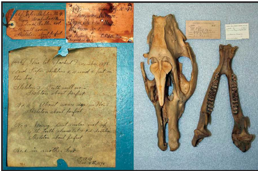
Figura 1. Ejemplar de Tapirus bairdii depositado en la colección del Museo Peabody en la Universidad de Yale (YPM) (YPM 7143). Izquierda: Etiquetas originales del ejemplar. Derecha: Cráneo colectado en 1873, en la localidad de Acapulco, Guerrero, México.

Este registro amplía la distribución histórica del tapir a 238 km de la Tuza de Monroy y 209 km desde Putla de Guerrero hacia el norte por la vertiente del Pacífico (Figura 2) y representa el registro más septentrional del tapir en el Continente Americano. El hallazgo de éste registro es de gran relevancia ya que indica que el área que ocupó la especie hasta hace algunos años, fue más extensa de lo que hasta ahora se conocía.