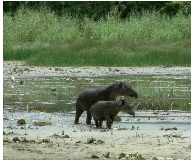
FIGURA 2. a) RATÓN TLACUACHE ( Tlacuatzin canescens ) FOTO: ERNESTO PERERA, b) MURCIÉLAGO OREJÓN DE GARGANTA AMARILLA ( Lamproncyteris brachyotis ) FOTO: JOSÉ CÚ, c) PUERCOESPÍN ( Sphiggurus mexicanus ) FOTO: JOSÉ CÚ Y d) TAPIR ( Tapirus bairdii ) FOTO: RAFAEL REYNA, LA REGIÓN DE CALAKMUL AL SUR DEL ESTADO MANTIENE UNA DE LAS POBLACIONES MÁS NUMEROSAS DE MÉXICO.