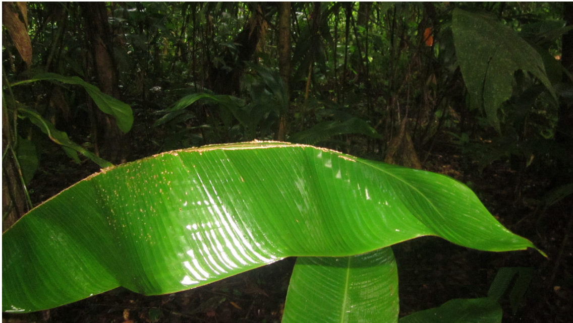
Figura 2. Imagen de Heliconia latispatha (platanillo) usada como tienda para percheo de Ectophylla alba a una altura de 1.55 mts del suelo, con una longitud de hoja de aproximadamente 87 cm por 25 cm de ancho. Nótese las perforaciones en la vena principal de la hoja hechas por los murciélagos para poder sostenerse al momento de perchar.