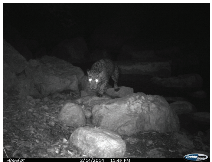
Figura 2. Registros fotográficos de jaguar en bosque mesófilo de montaña en la localidad de San Cristóbal en el municipio de la Misión, en la Sierra Gorda en el estado de Hidalgo.