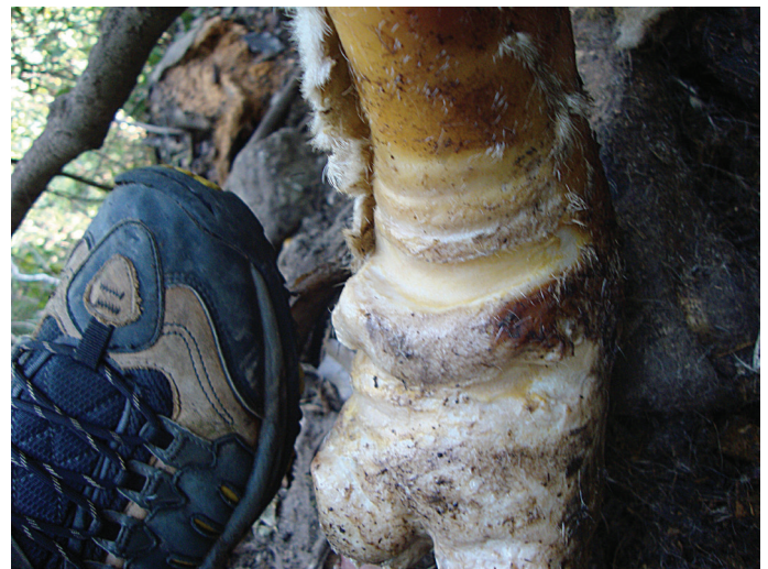
Figura 1. Cráneo del bovino donde se muestra una incisión en la región distal del hueso parietal del lado derecho y pata del bovino donde se muestra el desgarramiento originado por el colmillo del jaguar. La localización de la herida en la cabeza coincide con la forma de ataque del jaguar.