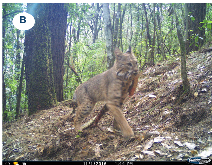
Figura 3. El 1 de noviembre se fotografió a un gato montés ( Lynx rufus escuinapae ) pasando enfrente de la cámara a las 12:45 horas en dirección sur (A). Una hora después (13:44) se fotografió y grabó al gato montés con un ejemplar de cincuate ( Pituophis lineaticollis ) en el hocico en dirección norte (B).