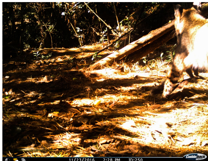
Figura 5. Registro fotográfico de un gato montés con una ardilla arborícola ( Sciurus aureogaster ) en el hocico.

cola melánica, en dirección oeste (Figura 5). Esta especie de ardillas son abundantes en el parque y, además, fueron registradas en el foto-trampeo en la misma área de la depredación (Figura 6). En el cuadro 1 se muestran los parámetros generales de las imágenes que capturaron dichas depredaciones.