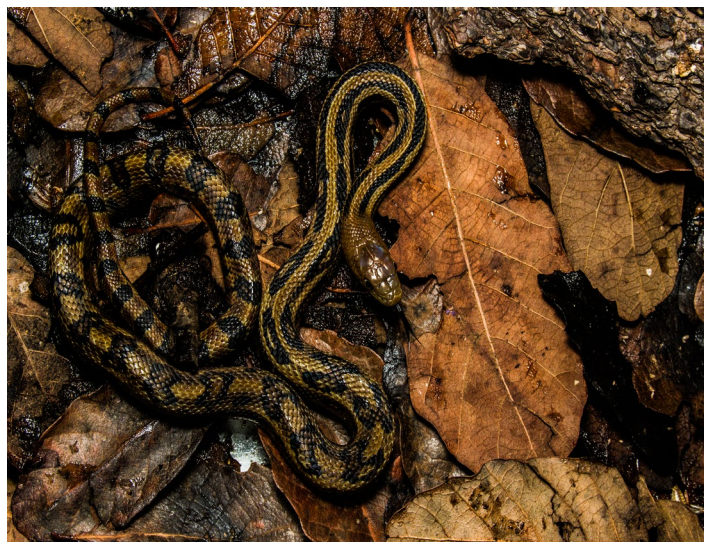
Figura 4. Registro de un cincuate juvenil Pituophis lineaticollis en los recorridos realizados en el PEHG.