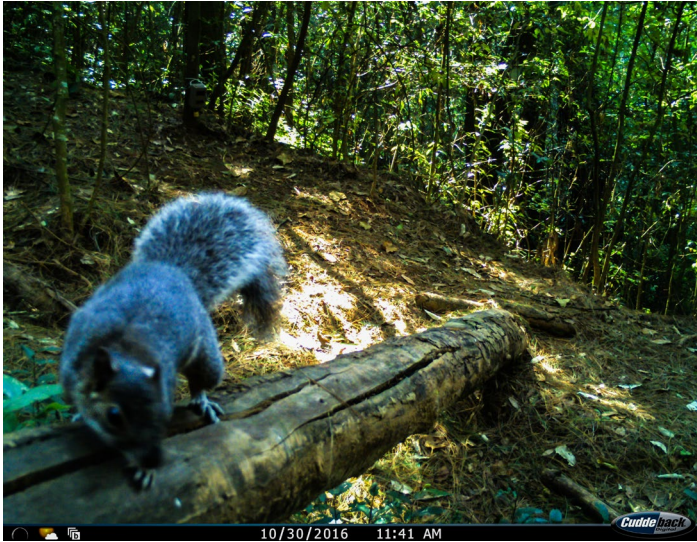
Figura 6. La ardilla arborícola ( Sciurus aureogaster ) es de las especies más abundantes en el área.

correspondiente a la época de lluvias reportados en seis localidades de México en donde los reptiles y los roedores son los dos grupos de presas más comunes e importantes para estos felinos, tercero y segundo lugar respectivamente después del grupo de los lagomorfos (Bárcenas-Rodríguez, 2010).