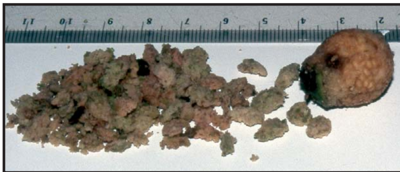
Figura 1. Fruto de Psidium guajava consumido por Artibeus lituratus en la localidad de estudio.

familia Myrtaceae. De otras familias como Moraceae, se identificó el higo ( Ficus sp.), de la Fabaceae una leguminosa desconocida y tres especies distintas aún no identificadas. La pumarrosa, guayaba, cínarro e higo son de amplia distribución y abundancia en Venezuela (Hoyos, 1989). Las hojas consumidas por A. lituratus