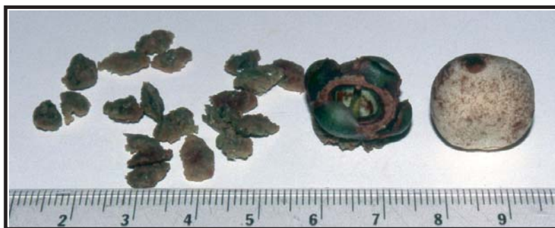
Figura 2. Fruto de Syzygium jambos consumido por Artibeus lituratus en la localidad de estudio.