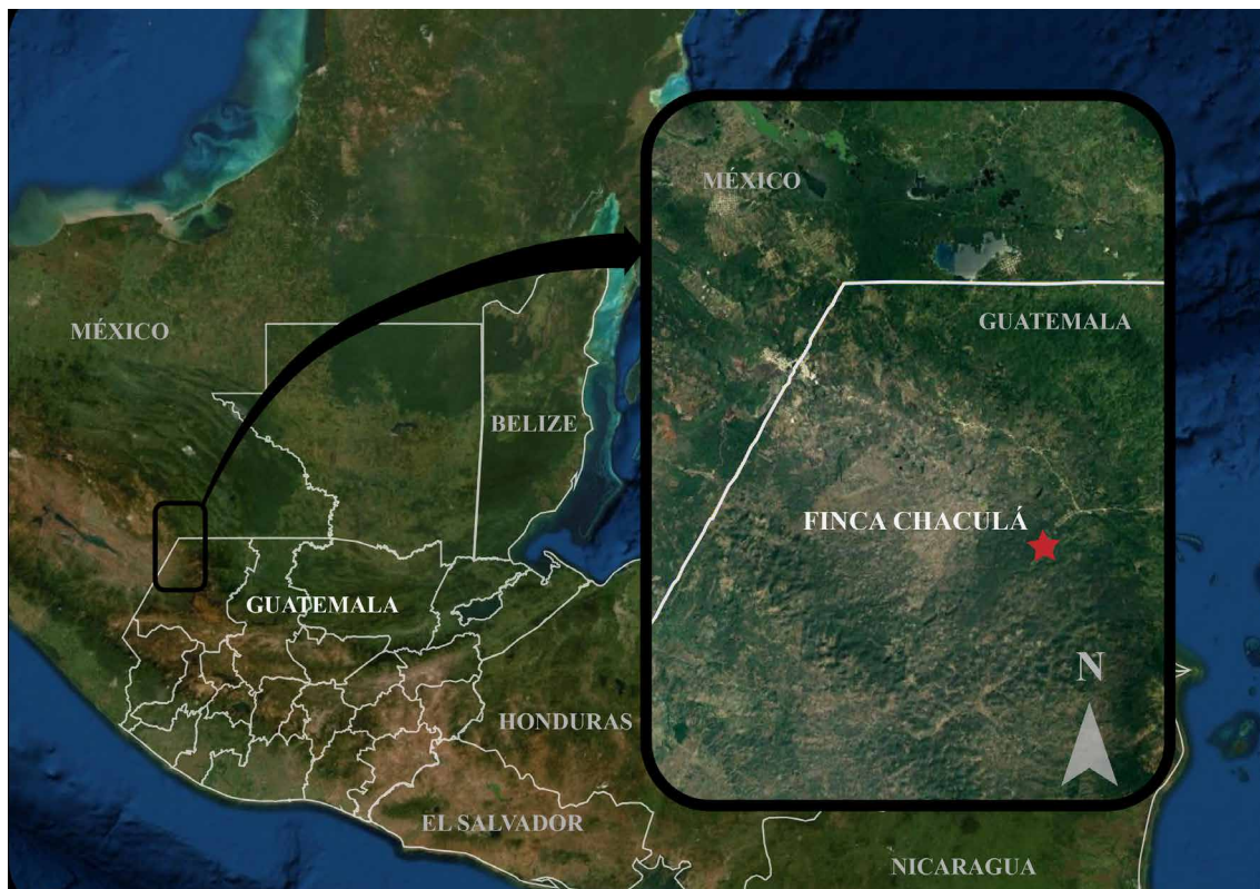
Figura 1. Ubicación de La Finca Chaculá en el municipio de Nentón, Huehuetenango, Guatemala.