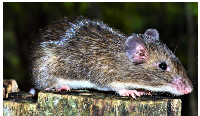
Figura 8. Ratón espinoso ( Liomys salvini ).

Orden Carnivora. Un total de 16 especies habitan esta región, dos especies de cánidos, la zorra Urocyon cinereoargenteus y el coyote Canis latrans , los cuales son comunes. También es posible encontrar tres especies de mofetas ( Mephitis , Spilogale y Conepatus ), M. macroura es más común en tierras bajas áridas (Davis y Russell, 1954) y los bosques deciduos (Ten Hwang y Larivière, 2001). Entre los prociónidos es común el mapache Procyon lotor , asociado