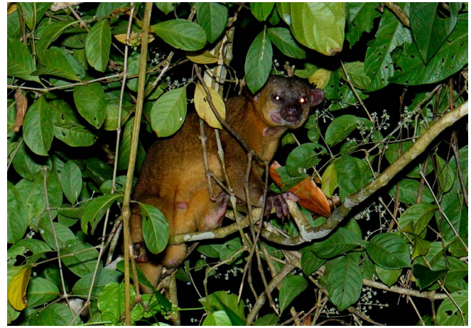
Figura 10. Cuyúso ( Potos flavus ).

a humedales. Las especies arborícolas como el cuyúso o martucha ( Potos flavus ) y el pizote o coati ( Nasua narica ) son menos abundantes. Los mustélidos son también raros en el bosque seco, la nutria ( Lontra longicaudis ) y el glotón ( Galictis vittata ) se reportan únicamente en bosques del Pacífico sur. En cambio, la comadreja ( Neogale frenata ) y el columuco o cabeza de viejo ( Eira barbara ) aún pueden encontrarse en algunas Reservas de toda la región (Figura 10).