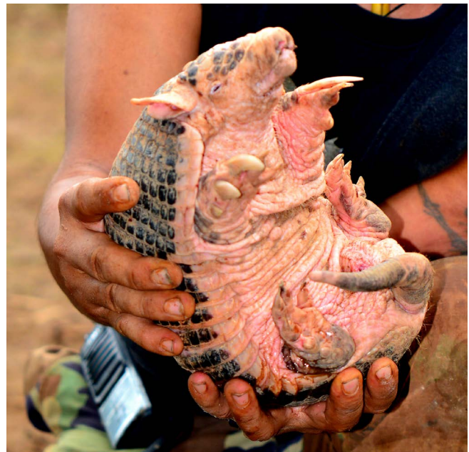
Figura 6. Armadillo centroamericano ( Cabassous centralis ).

Orden Rodentia. Veinticinco especies de roedores (57% del total del país) habitan la región. Entre ellas, una especie de ardilla ( E. variegatoides ) con tres subespecies, una es endémica del Pacífico norte E. v. adolphei ; una es endémica de la isla de Ometepe E. v. ometepensis ; y E. v. dorsalis que se distribuye del bosque seco del Pacífico central y sur (Managua a Rivas) hasta el norte de Costa Rica (Genoways y Timm, 2019). El Pacífico del país es también hábitat de una especie de taltuza Orthogeomys matagalpae (endémica de Nicaragua y Honduras), en las zonas medias del Pacífico central (Managua, Carazo y Granada). Además, es posible encontrar una rata espinosa ( Proechimys semispinosus ), la cual, aunque es típica de los bosques lluviosos es posible encontrarla en bosques riparios de la costa lacustre de Rivas.