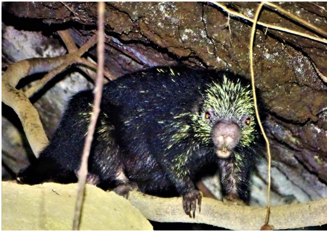
Figura 9. Zorro espín ( Coendou mexicanus ).