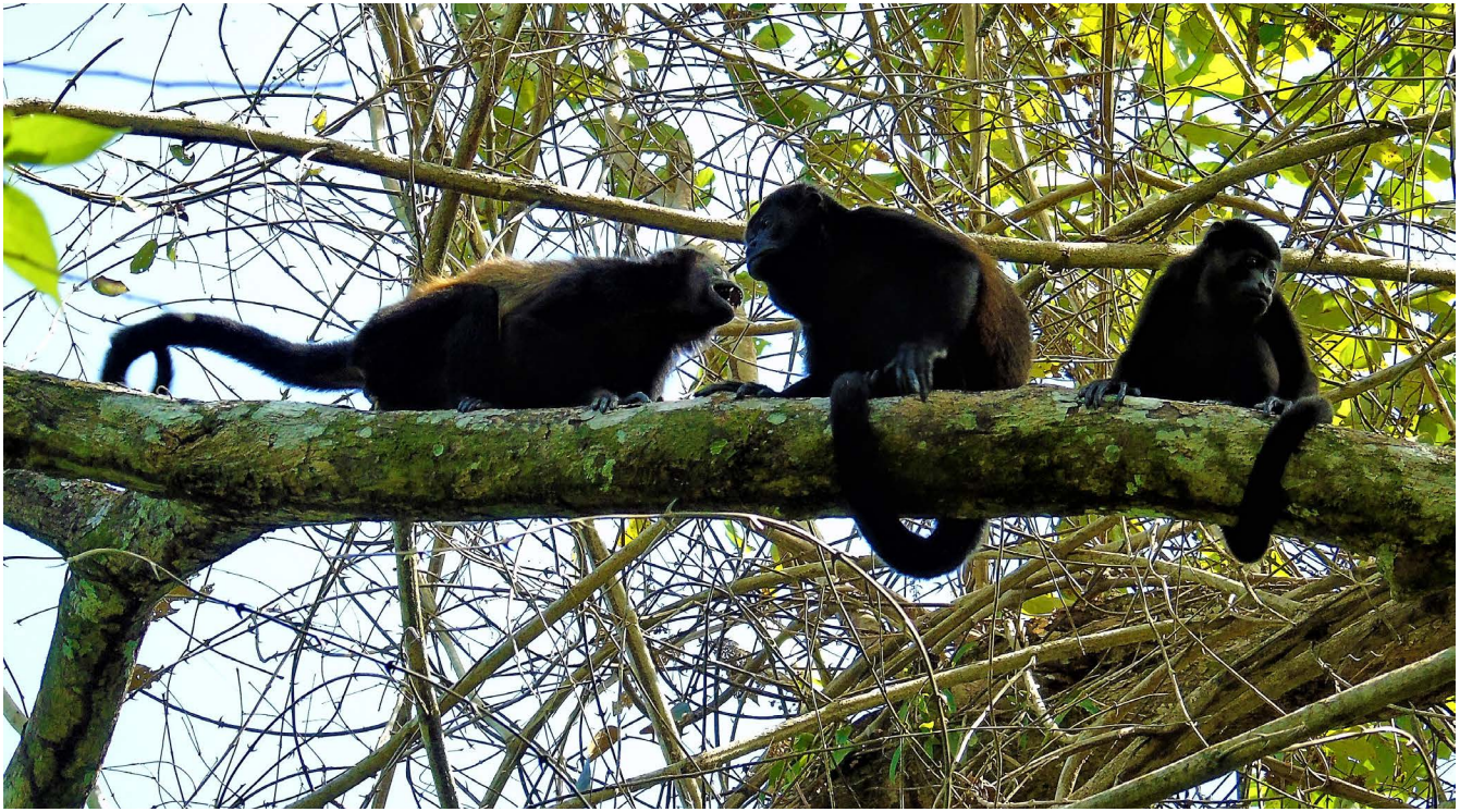
Figura 7. Mono congo ( Alouatta palliata ).

La familia Heteromidae presenta dos especies, Heteromys desmarestianus y Liomys salvini . H. desmarestianus a pesar de ser característica de los bosques húmedos, también habita los bosques riparios del sureste de Rivas; y el ratón espinoso L. salvini , presenta una amplia distribución y dos subespecies ( L. s. vulcani y L. s. salvini ). Además, coexisten 14 especies de ratones cricétidos, entre ellos el ratón de la meseta Reithrodontomys paradoxus endémico de Nicaragua y Costa Rica (Jones y Genoways, 1970); y tres especies de ratones múridos introducidos con poblaciones silvestres. Por último, se encuentran tres especies de roedores de porte medio, el zorro espín ( Coendou mexicanus ), la guatusa ( Dasyprocta punctata ) y la guardatinaja o tepezcuintle ( Cuniculus paca ), esta última poco común debido a la presión cinegética (Figuras 8 y 9).