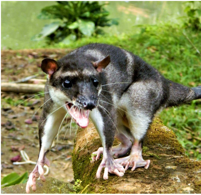
Figura 3. Zarigüeya acuática ( Chironectes minimus ).

municipio de Cárdenas, en la vegetación riparia principalmente (Figuras 4 y 5).