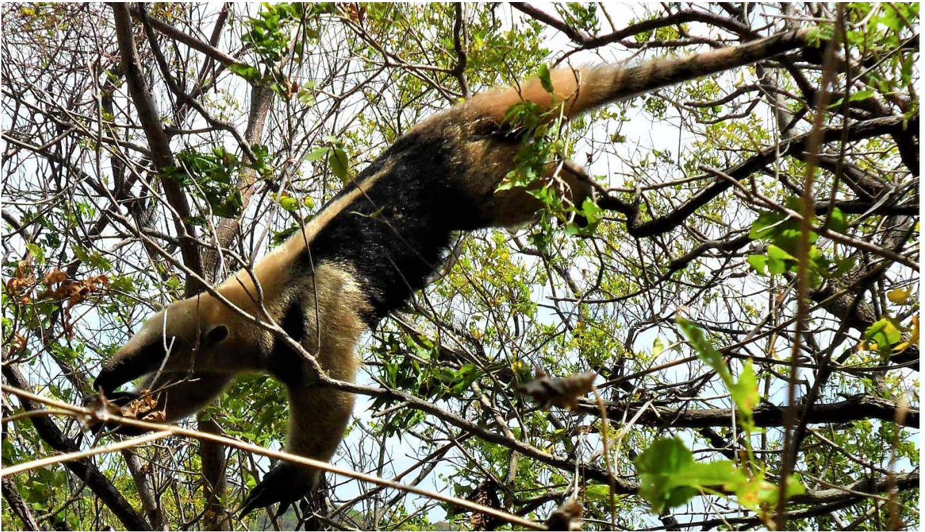
Figura 4. Hormiguero norteño ( Tamandua mexicana ).