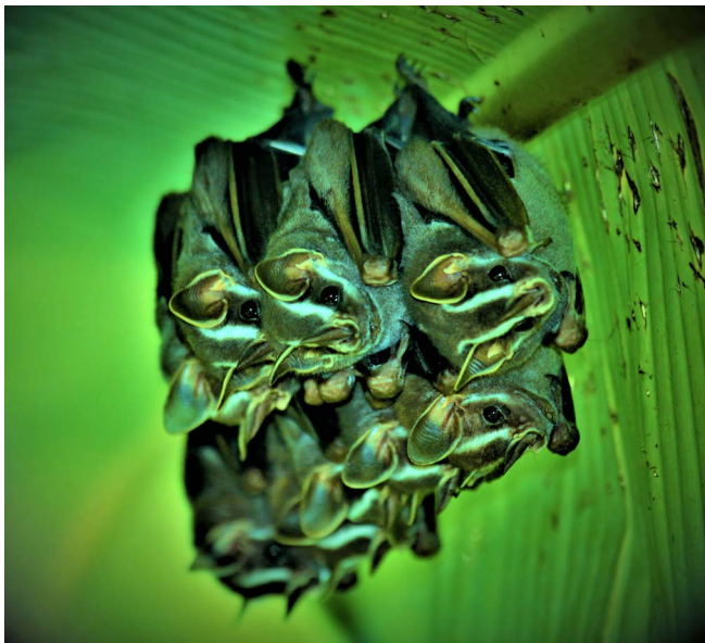
Figura 11. Murciélago listado ( Uroderma convexum ).

El 87% de los nicaragüenses viven en la vertiente pacífica (PNUD, 2000), lo que significa una presión social sobre el bosque seco siete veces mayor al resto de ecosistemas del país (Alianza Nacional del Bosque Seco, 2011).