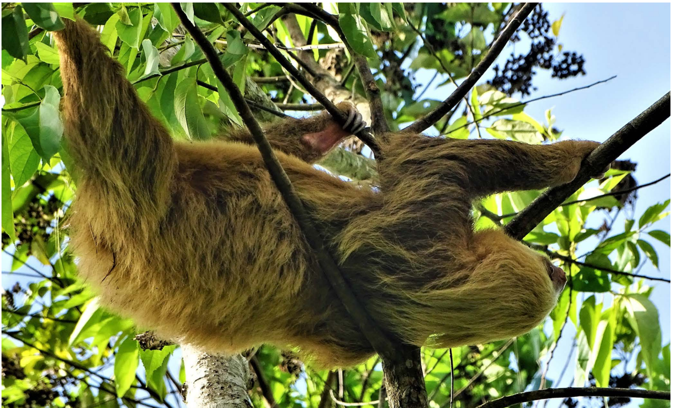
Figura 5. Perezoso bigarfiado ( Choloepus hoffmanni ).