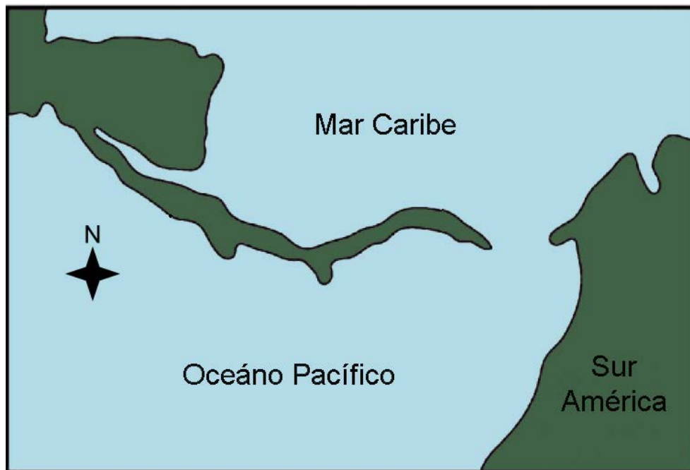
Figura 2. Centroamérica como península de Norteamérica (Modificado de Whitmore y Stewart, 1965).

De acuerdo con Vrba (1992) estas especies eran favorecidas por hábitats abiertos y continuos, los cuales eran comunes en el istmo centroamericano, mientras que los ambientes forestales eran escasos. Por otro lado, Webb (1978) indica que al menos 22 de los 31 géneros de mamíferos involucrados entre los dos continentes a finales del Plioceno y principios del Pleistoceno, eran formas adaptadas a sabanas. Por ejemplo, los mamuts ( Mammuthus ), los cuales vagaron por praderas de la cordillera volcánica hasta hace 1.5 Ma a 10,000 años a.C. (Lucas et al. , 2008; Lucas y Alvarado, 2010).