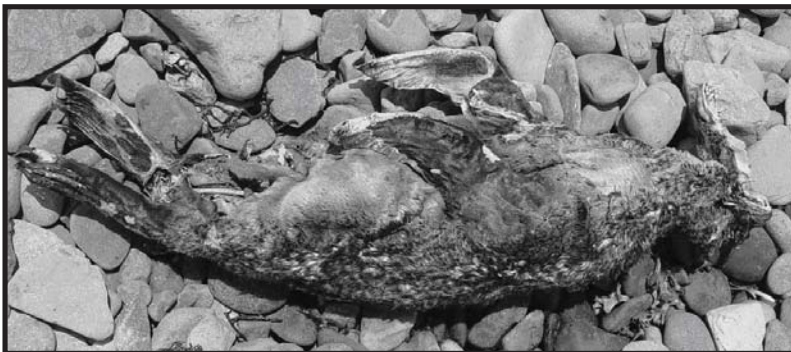
Figura 2. Cadáver de una cría de lobo marino de California con indicios de haber sido devorada por perros ferales en Isla de Cedros, Baja California.